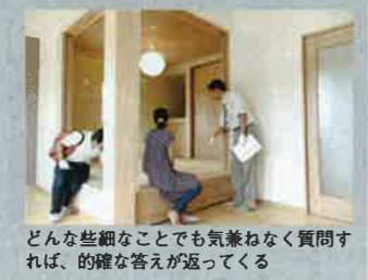
どんな些細なことでも気兼ねなく質問すれば、的確な答えが返ってくる

五十嵐惣一工務店では、「完成・構造見学会」を積極的に開催している。木造（骨組み）へのこだわりやバランスのいい構造体を見れば、きっと同社の住まいるづくりにへの思いが伝わってくるだろう。施工現場の見学も随時行っている。ぜひ問い合わせしてみよう。