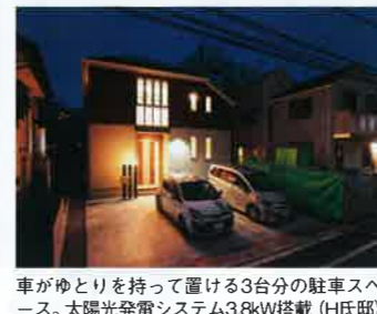
車がゆとりを持って置ける3台分の駐車スペース。太陽光発電システム3.8kW搭載（H氏邸）