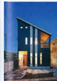
真南向きの片流れ屋根に、太陽光発電システム8.15kWを搭載したエコロジー住宅（Y氏邸）