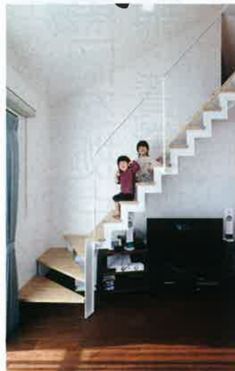
子どもたちもお気に入りのストリップ階段は、空間を軽やかにしてくれる効果も（C氏邸）