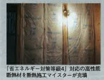
「省エネルギー対策等級4」対応の高性能断熱材を断熱施工マスターが充填