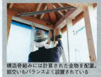
構造骨組みには計算された金物を配置。筋交いもバランスよく設置されている