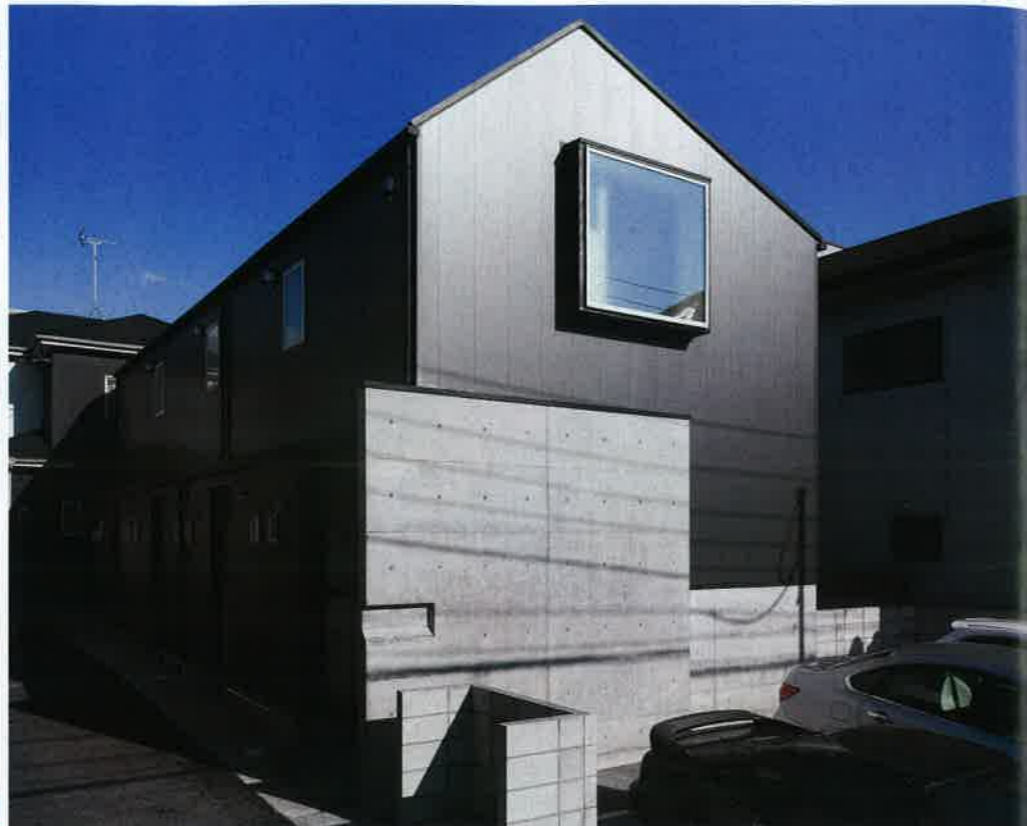
ガルバリウム鋼板に包まれたシャープなデザインの賃貸併用住宅。メゾネットタイプなのでファミリーはもちろん、シングル世帯にも人気がある。五十嵐惣一工務店では、周辺の物件状況も調べながら、的確なプランニングを行ってくれる（I氏邸・賃貸併用物件）