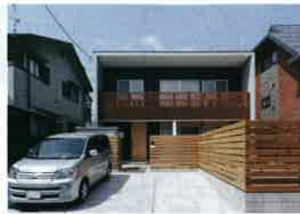
余計な装飾等は排除して価格を抑え、デザイン性と耐震・省エネ性を追求（施工モデル）