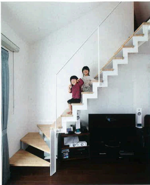
限られた空間が重く感じないようにストリップ階段を採用。手摺や構造体を壁の色と合わせることで、より軽やかさが生まれている。一方、床の色はダークに。コントラストが美しい