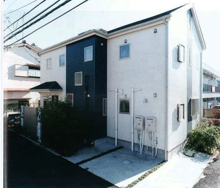
ツートンカラーのお洒落な佇まいのC氏邸は、二世帯住宅。玄関回りに対する外部からの視線を、自然な形で遮るように植栽や枕木を用いてデザインした。「縦格子のフェンスも、自然光を取り入れたいと思い、採用しました」とCさん(写真はすべてC氏邸)

この家が施せるエリア 東京都全域 都心部 城南・城西エリア 臨海エリア 城北エリア 武蔵野エリア 北多摩エリア 南多摩エリア 西多摩エリア 神奈川県 埼玉県 千葉県 その他エリア