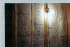
隅々まで充填された「省エネルギー対策等級4」対応の高性能断熱材