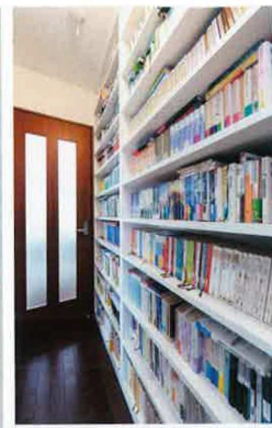
読書が大好きなCさんのこだわりの本棚。廊下スペースを巧みに利用したアイデア