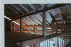
隅々まで充填された「省エネルギー対策等級4」対応の高性能断熱材