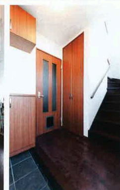
玄関は1か所。上下階で親世帯と子世帯が分かれるように設計。キャットドアも設置