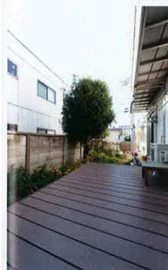
1階の親世帯には、広々としたデッキが。夏には子どもたちがプールを楽しみました!