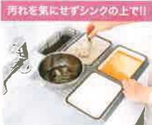
汚れを気にせずシンクの上で!!