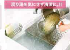
戻り湯を気にせず清潔に!!