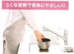
らくな姿勢で身体にやさしい!!